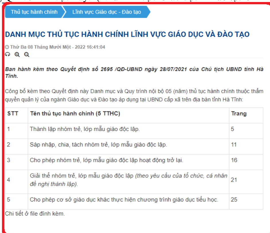
Hình 4: Lĩnh vực Giáo dục – Đào tạo

Với lĩnh vực chỉ có 1 quyết định công bố danh mục và quy trình thực hiện thủ tục hành chính chỉ cần tạo mỗi lĩnh vực 1 tin bài với nội dung nêu rõ danh mục và đính kèm quyết định công bố. Đây chính là bài đăng sẽ dẫn link thông qua hệ thống QR về lĩnh vực này. (Như lĩnh vực Giáo dục – Đào tạo ở hình 02).