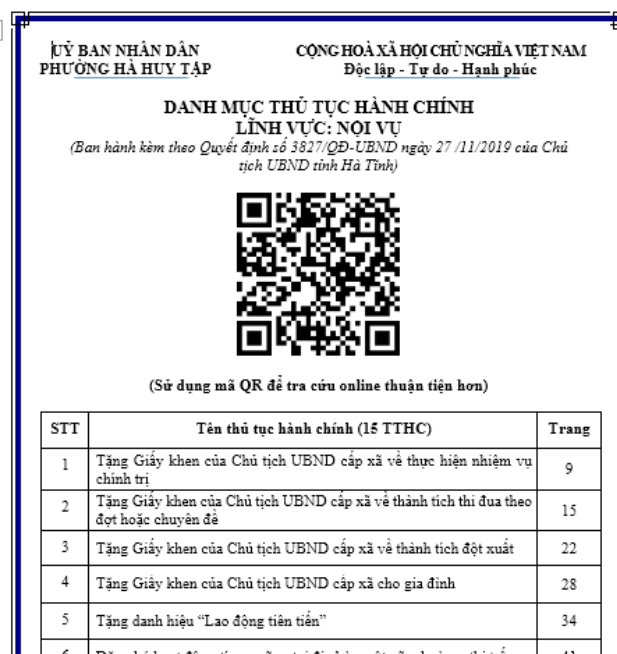
Hình ảnh niêm yết TTHC bằng mã QR code

Bước 3: Tải xuống mã QR Code và sử dụng niêm yết theo đúng danh mục tại bảng niêm yết. Như hình 6