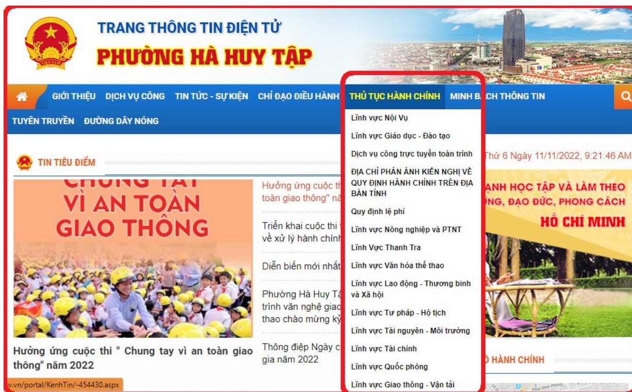
Hình 1: tạo danh mục

Tạo một danh mục “THỦ TỤC HÀNH CHÍNH” trên menu chính của trang thông tin điện tử sau đó tạo các danh mục con của “THỦ TỤC HÀNH CHÍNH” các danh mục con chính là các lĩnh vực thủ tục hành chính thuộc thẩm quyền xử lý của UBND cấp xã cụ thể gồm: Lĩnh vực nội vụ; Lĩnh vực Giáo dục – Đào tạo; Dịch vụ công trực tuyến toàn trình; Địa chỉ phản ánh kiến nghị; Quy định lệ phí; Lĩnh vực Nông nghiệp và PTTN; Lĩnh vực Thanh tra; Lĩnh vực Văn hóa thể thao và du lịch; Lĩnh vực thanh tra; Lĩnh vực Lao động thương binh và Xã hội; Lĩnh vực Tư pháp – Hộ tịch; Lĩnh vực Tài nguyên và môi trường; Lĩnh vực tài chính; Lĩnh vực Quốc phòng và Lĩnh vực giao thông vận tải.